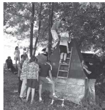
úprava studánky Javorka

Žáci osmé třídy v hodinách pracovního vyučování pomohli opravit studánku Javorku. Nad pramenem Javorka je kamenná stavba a její střeška již potřebovala nový nátěr. Kluci plechovou střešku očistili a znovu natřeli. Opravili dvířka a vyčistili vnitřek studánky. Okolí studánky, která je často zastávkou turistů, je nyní uklizeno a studně je opět v pořádku. V minulosti byla Javorka zdrojem vody pro Kunžak, vedl odtud dřevěný vodovod, kterým se přiváděla voda do kašny na náměstí. Zmínka o Javorce je i v Sybilině proroctví.