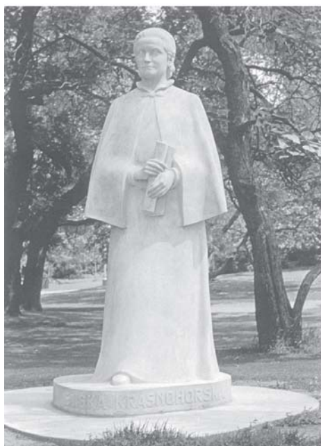
Socha Elišky Krásnohorské, Praha, Karlovo náměstí