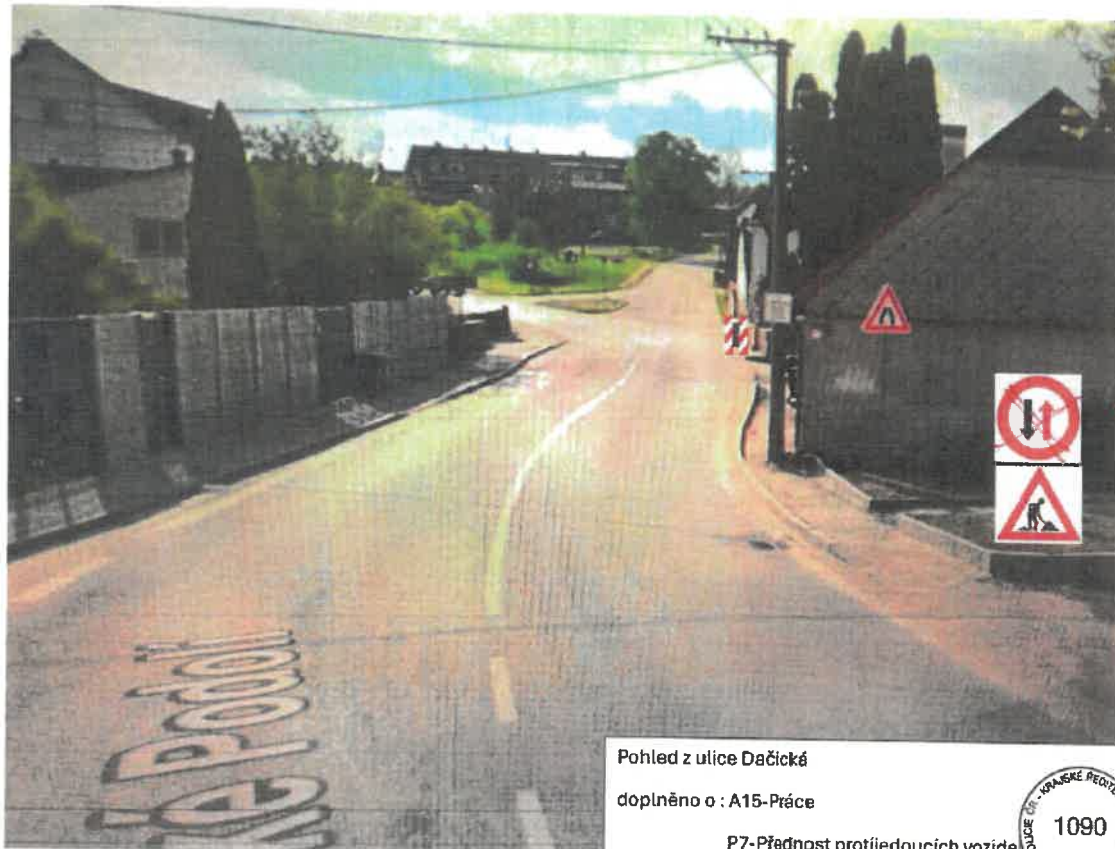
Pohled z ulice Dačická doplněno o : A15-Práce P7-Přednost protijedoucích vozidel